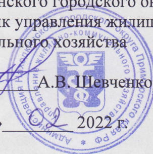
ГРАФИК полной остановки водопроводных сооружений и сетей для выполнения ремонтных работ на май-октябрь 2022 года.